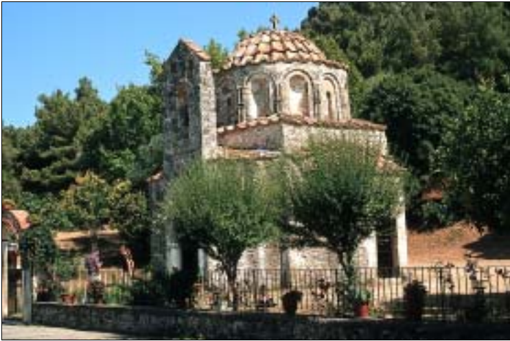
Fountoúkli – ein kunsthistorische Juwel