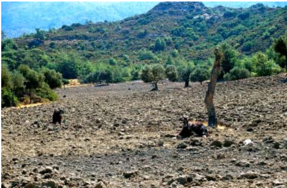
Steiniger Acker am Attávios